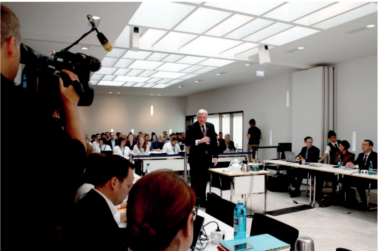
Vernehmung von Volker Bouffier im NSU-Untersuchungsausschuss.